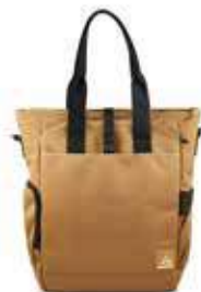
TOTE BAG OFFICE 406002020