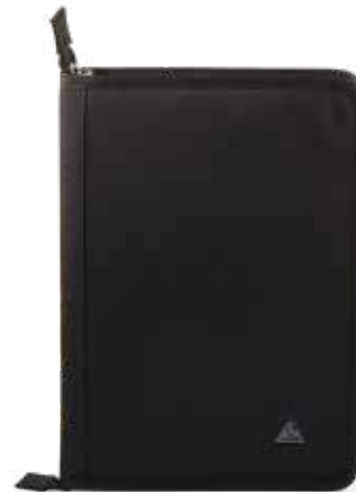
899 JET BLACK