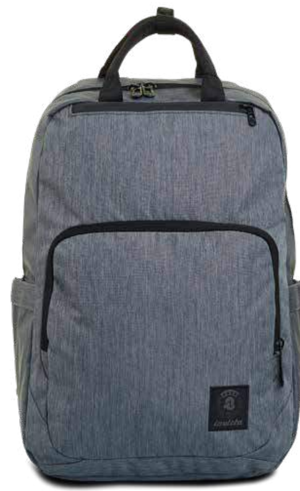
BG2 GREY 2TONE