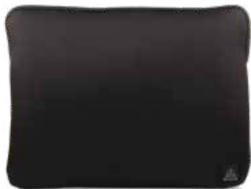
899 JET BLACK

Scoperto imbottito fino a internal padded up to 38x26x2cm