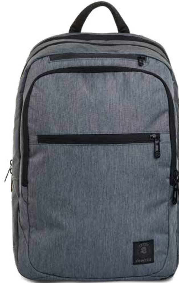
BG2 GREY 2TONE