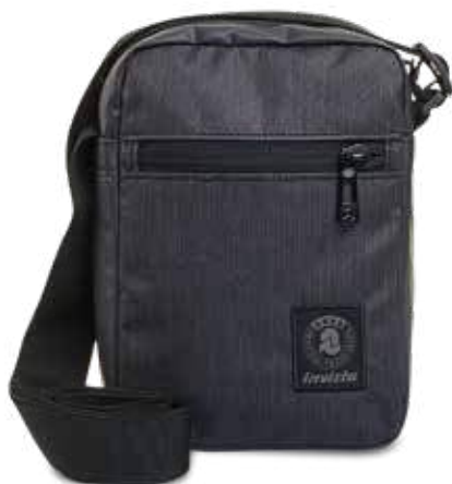
839 JET BLACK 2TONE