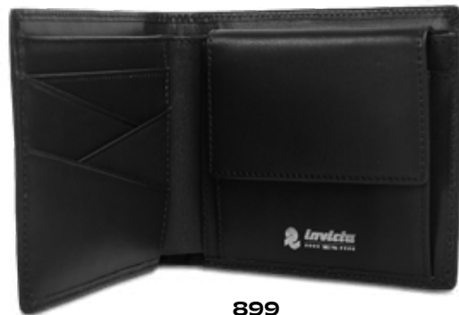
899 JET BLACK

TESSUTO / FABRIC: pelle / leather - FODERA / LINING: 100% poliestere / 100% polyester