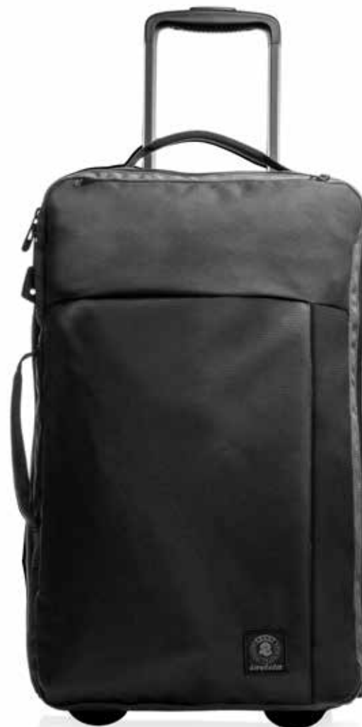
899 JET BLACK