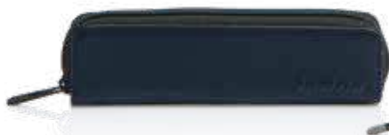
590 BLUE NAVY

logo con rilievo, tirazip personalizzato in metallo, apertura con lampo logo high relief, personalised metal zip puller, opening with zip