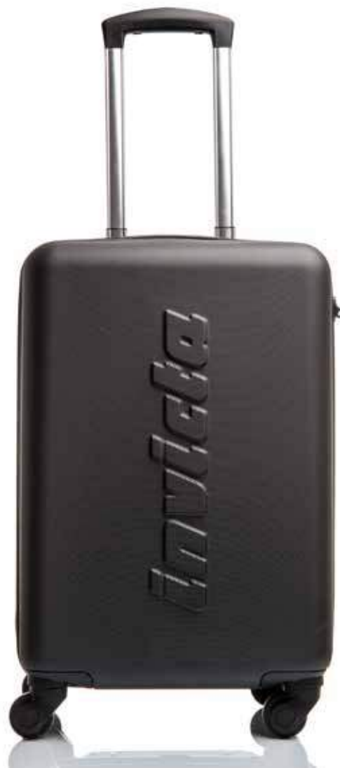
899 JET BLACK

CAPACITÀ / CAPACITY: 35 LT - DIMENSIONI / DIMENSIONS: 35X55X20 CM - PESO / WEIGHT: 2,5 KG