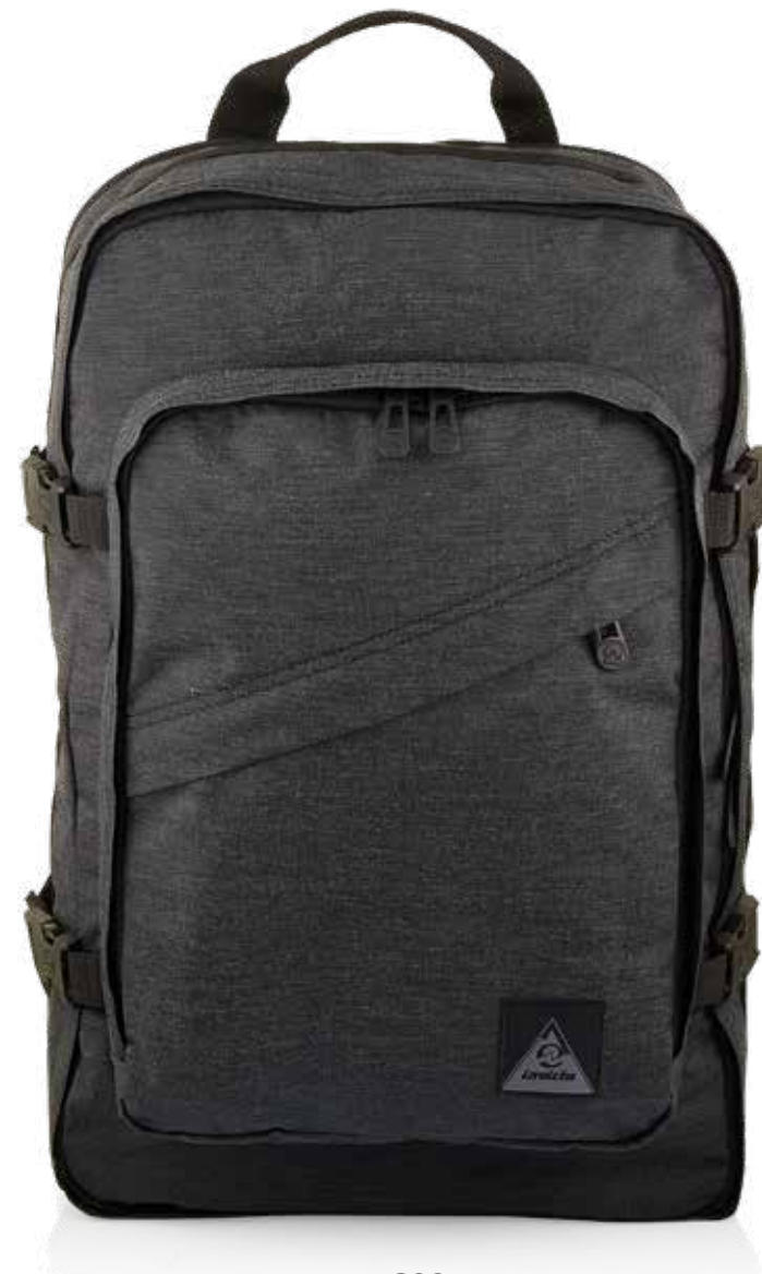
899 JET BLACK