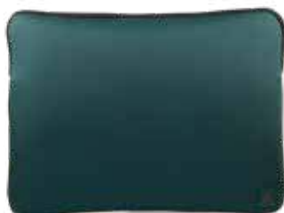
664 FOREST GREEN