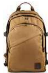
ROUND LUX BACKPACK 206002097