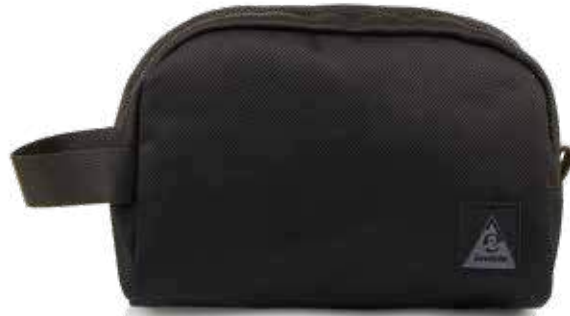
899 JET BLACK