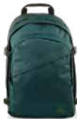
ROUND PLUS BACKPACK 2060020A4