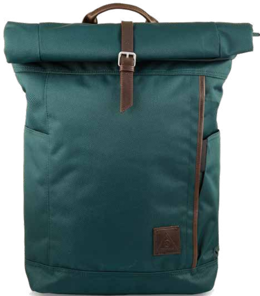
664 FOREST GREEN

CAPACITÀ / CAPACITY: 21,5 LT - DIMENSIONI / DIMENSIONS: 30X42X17 CM