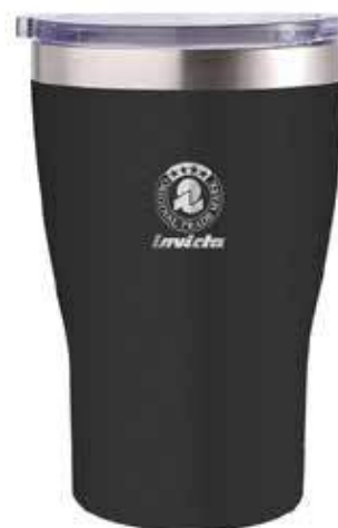
COLOR BLACK MATTE FINISHING

12 pezzi ( 6 x colore) / 12 pieces ( 6 x color)