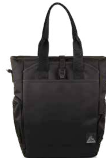
899 JET BLACK