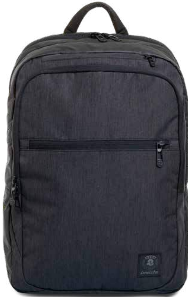
839 JET BLACK 2TONE

Biz L Backpack | CODICE / CODE 20600 21A8 CAPACITÀ / CAPACITY: 26 LT - DIMENSIONI / DIMENSIONS: 30X45X19 CM