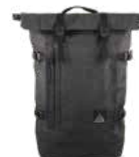
URBAN 2TONE BACKPACK 206002099