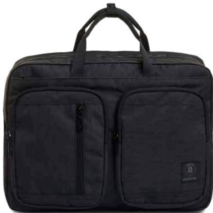
839 JET BLACK 2TONE