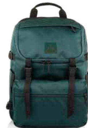
664 FOREST GREEN