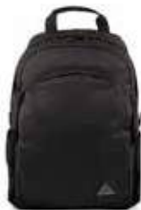
ROUND BACKPACK 206002096