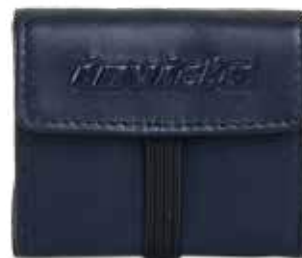
590 BLUE NAVY

logo in rilievo, scomparto porta monete, inserto in elastico sul retrop, apertura con elastico logo high relief, coin holder, elastic insert on back, opening with elastic