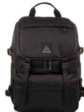
899 JET BLACK