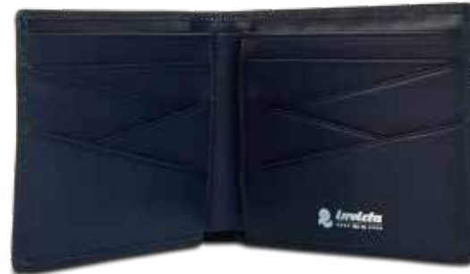
590 BLUE NAVY