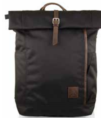
899 JET BLACK

TESSUTO / FABRIC twill poliestere con dettagli in pelle twill polyester and leather details