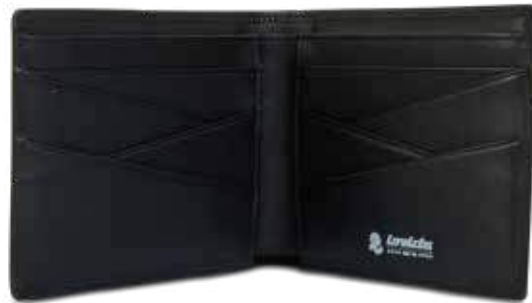
899 JET BLACK

TESSUTO / FABRIC: pelle / leather - FODERA / LINING: 100% poliestere / 100% polyester