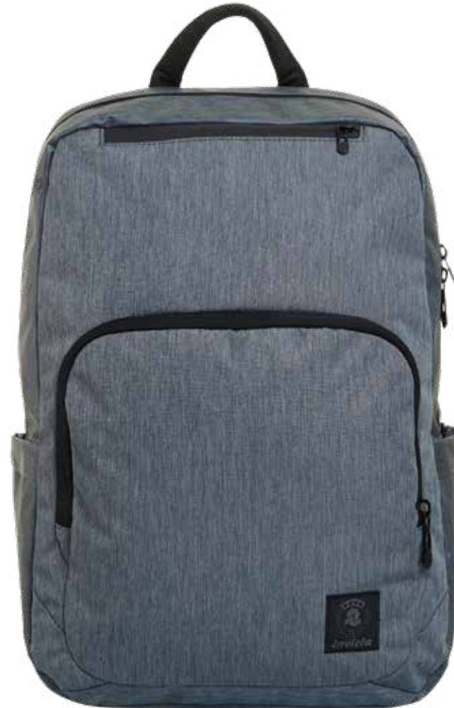
BG2 GREY 2TONE