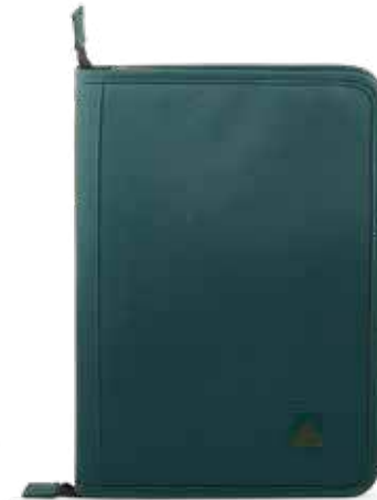
664 FOREST GREEN