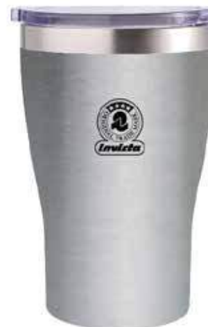
STEEL FINISHING SATINED FINISHING