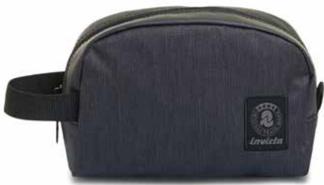
839 JET BLACK 2TONE