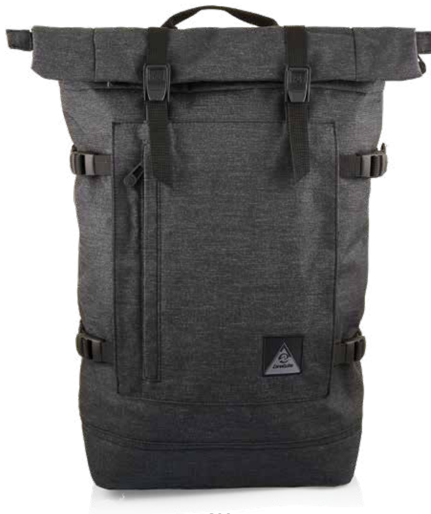
899 JET BLACK