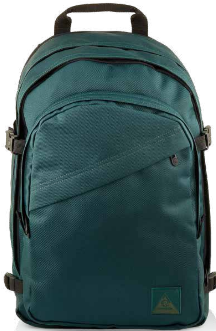
664 FOREST GREEN

CAPACITÀ / CAPACITY: 30 LT - DIMENSIONI / DIMENSIONS: 30X43X19 CM