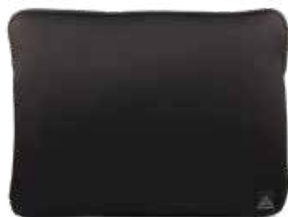
899 JET BLACK

Scoperto imbottito fino a internal padded up to 33x22,6x1,8cm