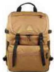
JOLLY OFFICE 206002095