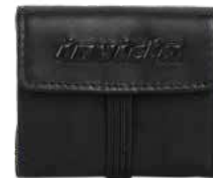
899 JET BLACK