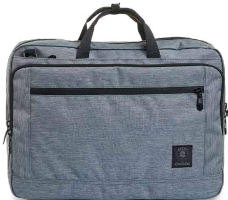
BG2 GREY 2TONE