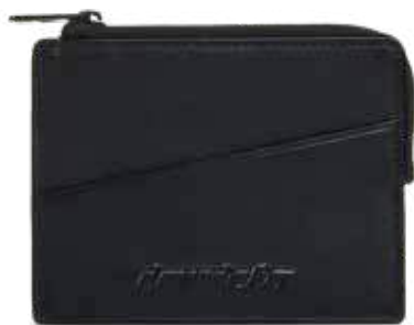
899 JET BLACK