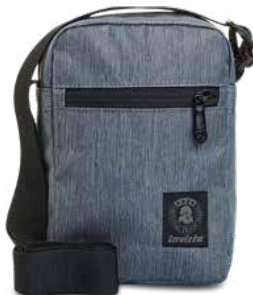
BG2 GREY 2TONE