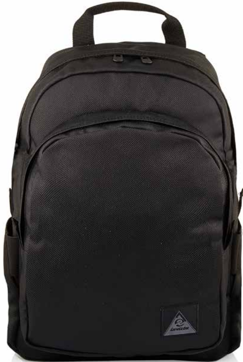
899 JET BLACK

CAPACITÀ / CAPACITY: 17 LT - DIMENSIONI / DIMENSIONS: 27X39X12 CM