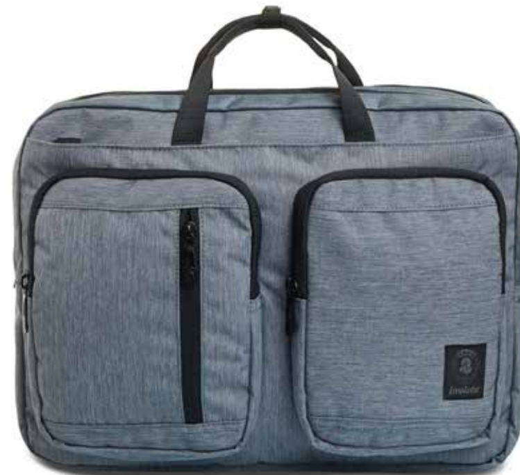
BG2 GREY 2TONE