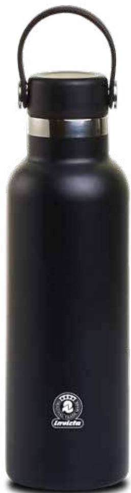
COLOR BLACK MATTE FINISHING

12 pezzi ( 6 x colore) / 12 pieces ( 6 x color)