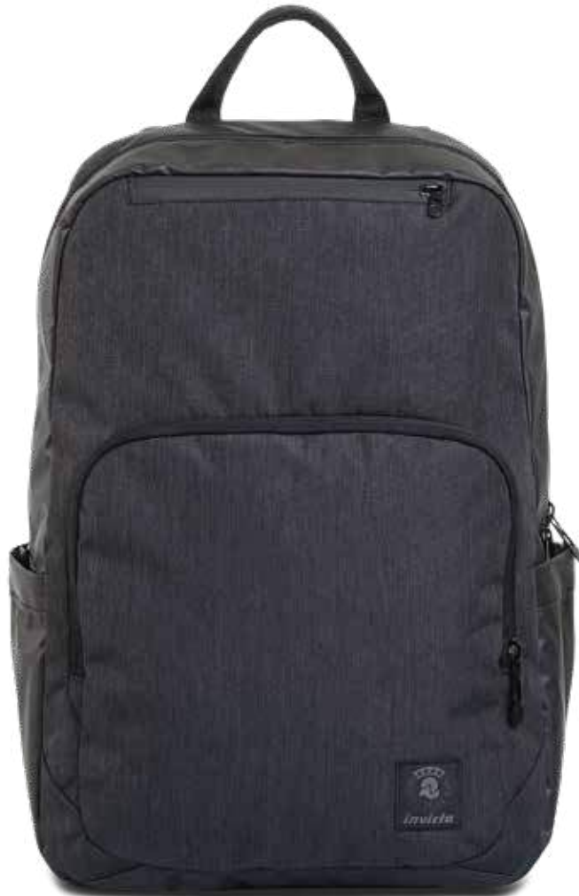
839 JET BLACK 2TONE

CAPACITÀ / CAPACITY: 20 LT - DIMENSIONI / DIMENSIONS: 30X45X16 CM