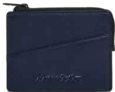
590 BLUE NAVY

logo in rilievo, scomparti porta carte di credito, scomparto porta monete con lampo al rovescio logo high relief, cards holder, coin holder with inside-out zip