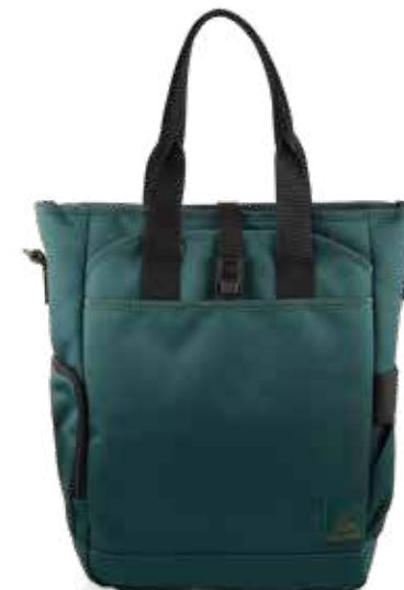
664 FOREST GREEN