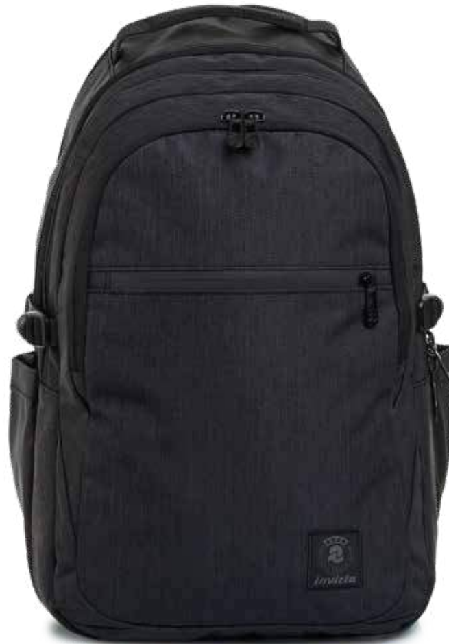
839 JET BLACK 2TONE