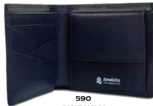
590 BLUE NAVY