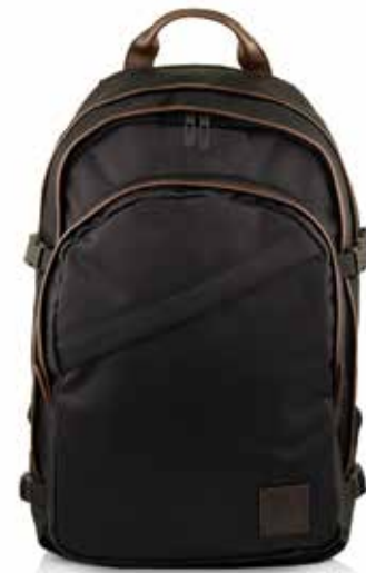
899 JET BLACK