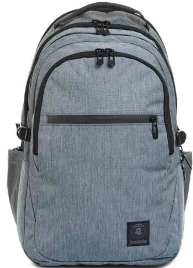
BG2 GREY 2TONE