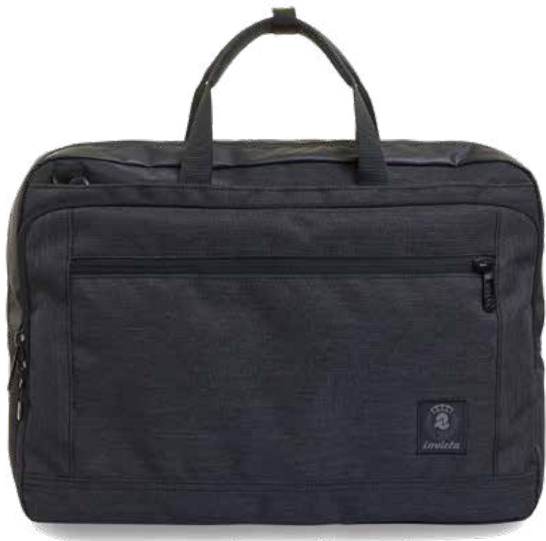
839 JET BLACK 2TONE