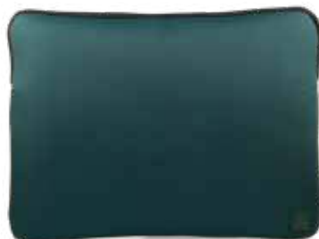
664 FOREST GREEN