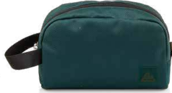
664 FOREST GREEN