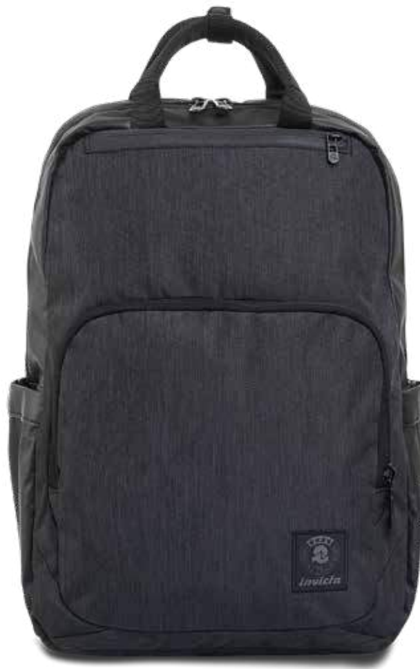
839 JET BLACK 2TONE