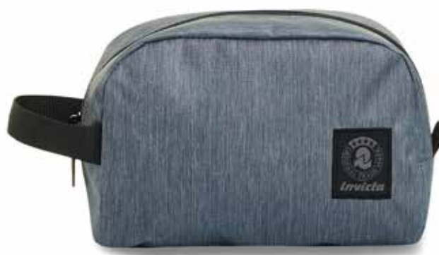
BG2 GREY 2TONE