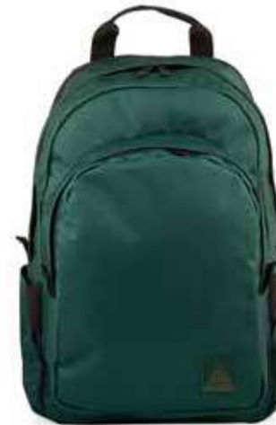
664 FOREST GREEN