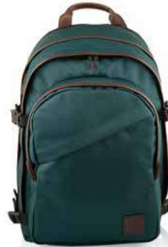
664 FOREST GREEN