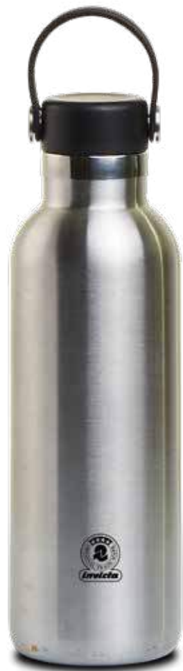
STEEL FINISHING SATINED FINISHING