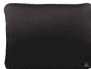
899 JET BLACK

Scoperto imbottito fino a internal padded up to 32x21,5x1,5cm