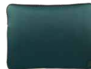
664 FOREST GREEN