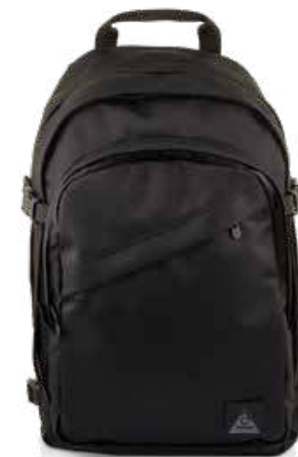
899 JET BLACK