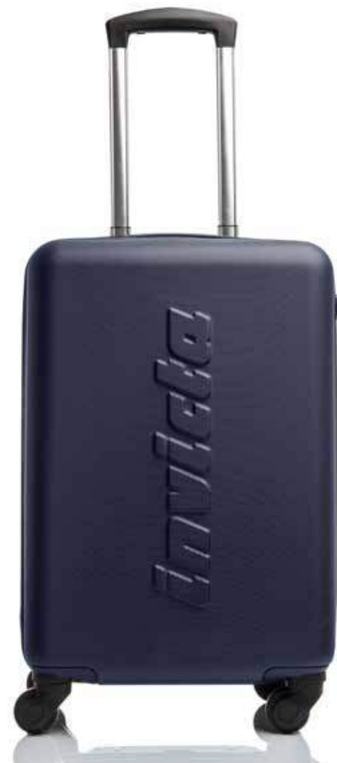
5C3 INDIAN INK