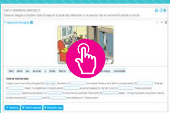
2000 ESERCIZI INTERATTIVI