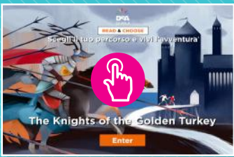
STORY GAME - STORIA INTERATTIVA A BIVI