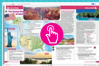
AUDIO INTEGRALE DI TUTTO IL CORSO