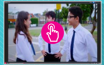
Video LANGUAGE LIVE